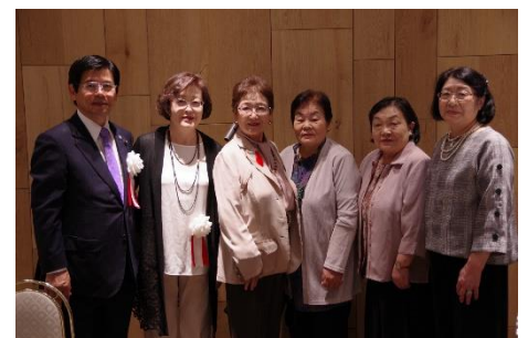
上高野後援会の皆さん