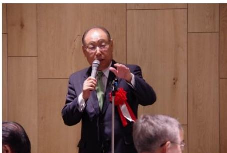
豊田俊郎参議院議員