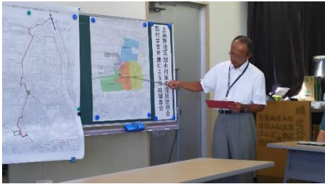
八千代市職員による説明

7月に西日本で豪雨災害が発生し、多数の生命が奪われ、多くの家屋が浸水し、甚大な被害がもたらされました。上高野でもかつて冠水被害があり、その対策が望まれるところです。地元住民の要請を受け、今年7月に市政報告会を開催し、八千代市としての対策につき市職員の説明の機会を設けました。11月の議会では、雨水対策として補正予算が盛り込まれる見通しです。