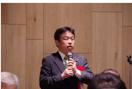
茂呂剛千葉県議会議員